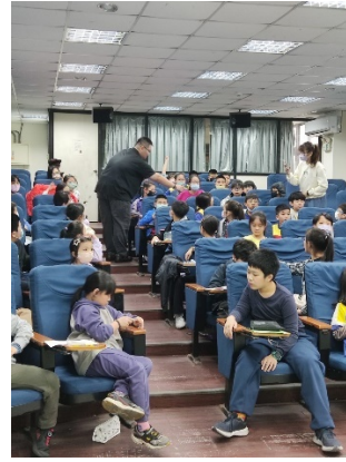
場次二:基隆市深美國小(139 人)